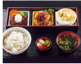
【和膳弁当B】 ¥1,390 (+税) ※和風ハンバーグ/ポークカツレツ /海老グラタン