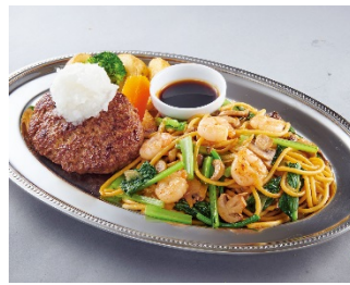
【和風ハンバーグ & ジャポネスパ】 ¥1,390 (+税)