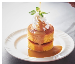
【ホットケーキ (キャラメルソース)】 ¥790 (+税)