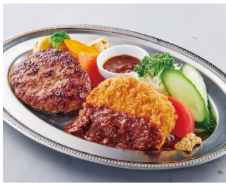
【ハンバーグ & ポークカツレツ】 ¥1,590 (+税)