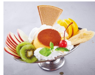
【プリンアラモード】 ¥590 (+税)