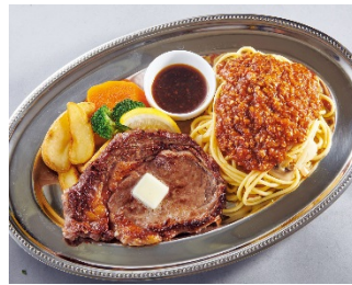
【リブローズステーキ & ミートソース】 ¥1,890 (+税)

※スパゲッティは ナポリタン/ミートソース/ジャポネスパ から、お選びいただけます。