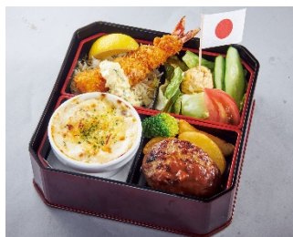
【お子様洋食弁当】 ¥890 (+税)