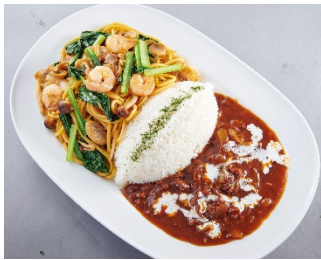
【ハヤシライス & スpaghetti】 ¥1,490 (+税)

※スパゲッティは ナポリタン/ミートソース/ジャポネスパ から、お選びいただけます。