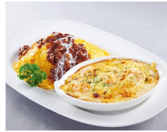
【ビーフハヤシのオムライス & 海老グラタン】 ¥1,490 (+税)