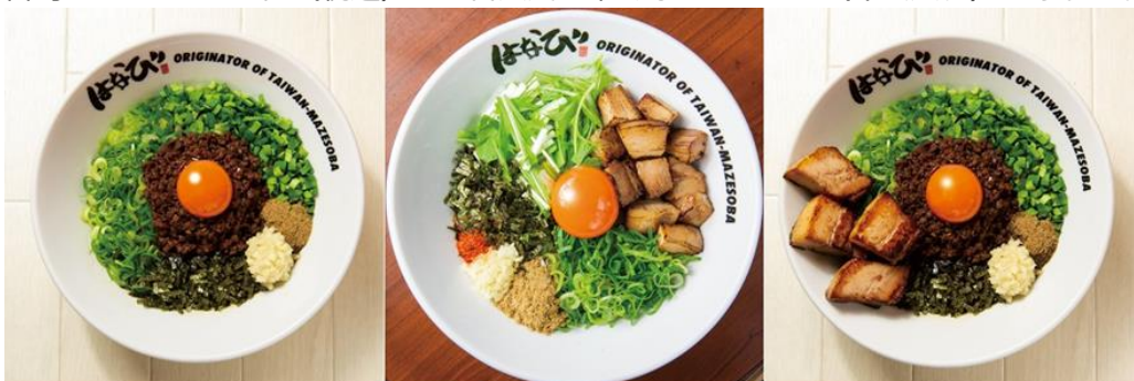
（画像左から） 台湾まぜそば 890円 / キミスタ 920円 / ド肉台湾 1,260円

台湾まぜそば890円（税込）が1番人気。辛くないまぜそば（キミスタ）もあります。