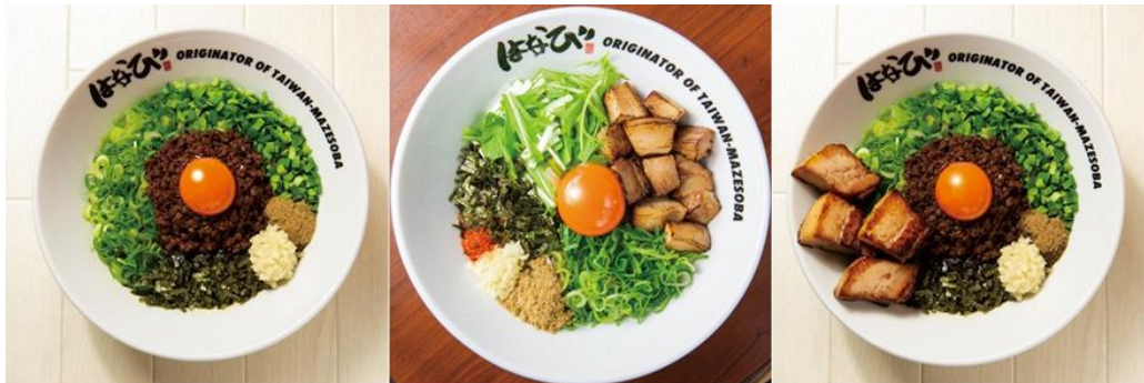
（画像左から）台湾まぜそば 970円 / キミスタ 970円 / ド肉台湾 1,370円

台湾まぜそば 970円（税込）が1番人気。辛くないまぜそば（キミスタ）もあります。