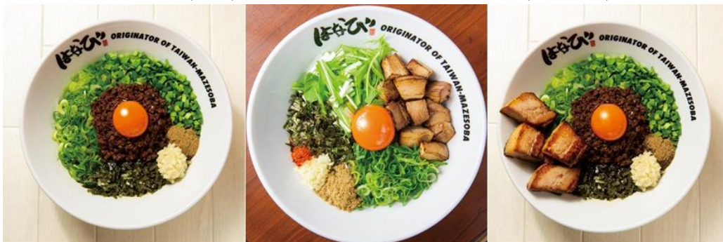
（画像左から）台湾まぜそば 970円 / キミスタ 970円 / ド肉台湾 1,370円

台湾まぜそば 970円（税込）が1番人気。辛くないまぜそば（キミスタ）もあります。