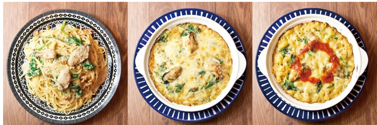
濃厚牡蠣とほうれん草の クリームパスタ