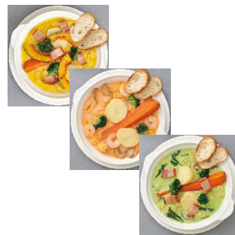
ごろごろ野菜と ショートパスタの 食べるポタージュスープ