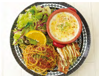
ピッコロプレートC (ミートソース&ミニドリア)

※ (ももいろ/みどり/きいろ) の ミニスープパスタはこちらから Choice ⇒