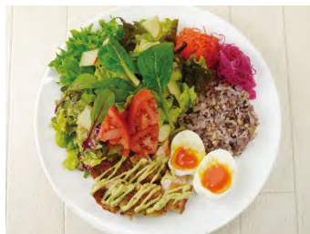
グリルチキンの サラダ GOHAN

エビやアボカドが入った、女性好みのサラダです。コブサラダドレッシングでお召し上がり下さい。