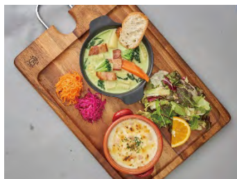
ミニドリア&ミニスープパスタ (ももいろ/みどり/きいろ)

熟成ベーコンを使用した、チーズ香る定番シーザーサラダ。シーザードレッシングでどうぞ。