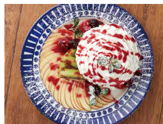
リンゴとベリーのパンケーキ

四川山椒のシビれる辛さがあと引く美味しさ。砕いたピーナッツをしっかりと絡めて召し上がれ♪