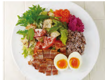
厚切りベーコンの シーザー風サラダ GOHAN

香ばしいチキンにバジルソースをかけました。ドレッシングは、パステルオリジナルの「農園ドレッシング（玉ネギ）」、または「くわ茶のドレッシング」がおすすめです。