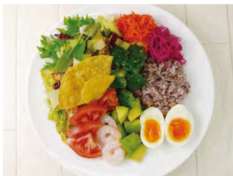
コブ風サラダ GOHAN スープ付